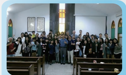
東勢信義養護中心參訪