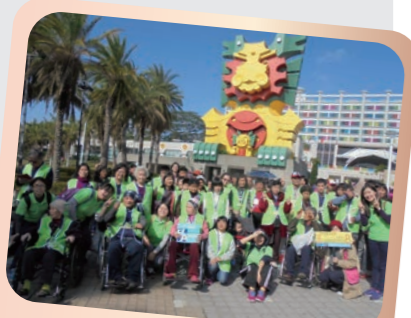
有愛無礙~第九屆真情之旅