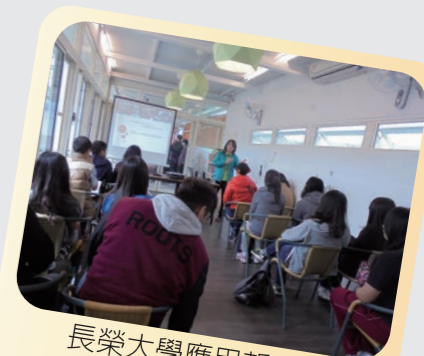
長榮大學應用哲學系 師生至福氣參訪