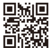
▲ 臺中市社區 發展資源網