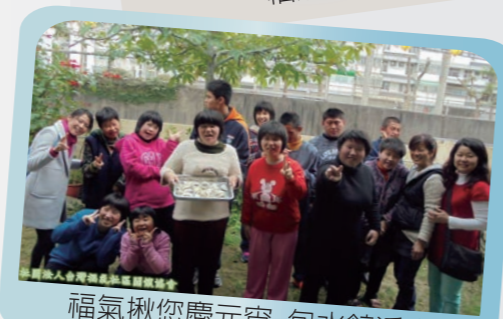
福氣揪您慶元宵-包水餃活動