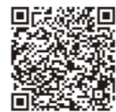
▲ 福氣協會FB 粉絲專頁

地址：433臺中市沙鹿區臺灣大道六段805號 電話：(04) 2631-3525 傳真：(04) 2631-3353 電子信箱：incu.ft@gmail.com