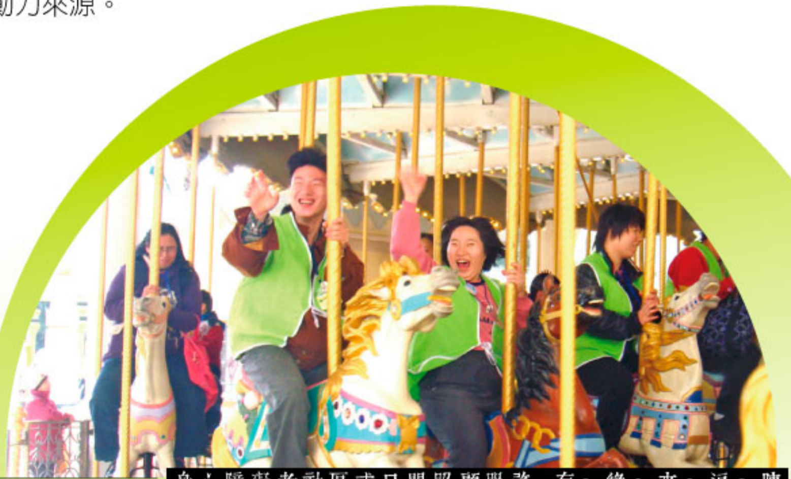
身心障礙者社區式日間照顧服務 有~緣~來~逗~陣