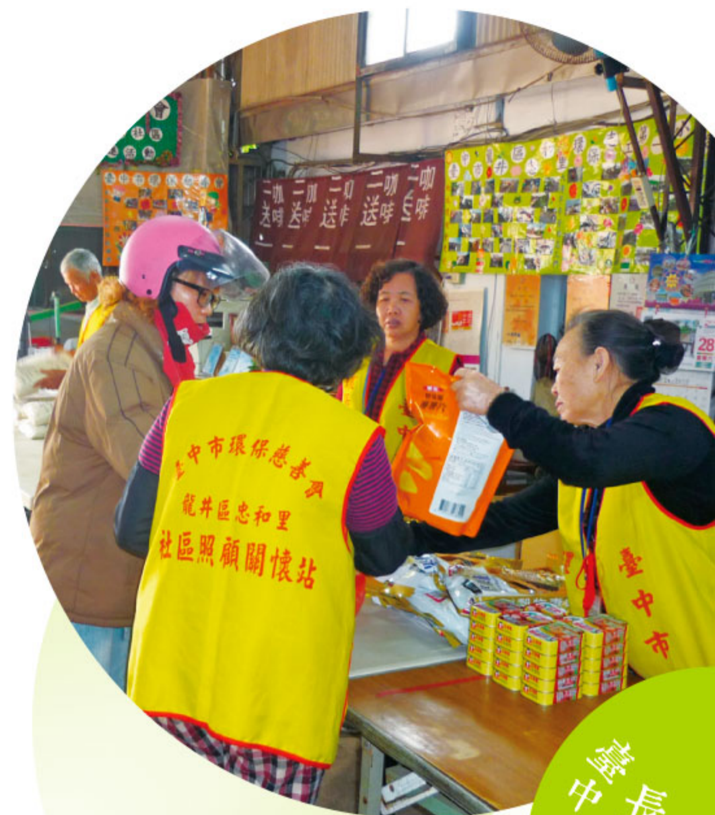
長青學苑 臺中市沙鹿區

藉由長青學苑的辦理，讓長輩們可以「活到老、學到老」，增進自我成長，實現老人達到「學無止境」之理想，藉以拓展老人學識領域、充實生活內容，提昇老人福利服務功能，為了可以服務更多的長輩，尤其是針對交通能力較為薄弱的長輩，更是特意將課程送進社區，減低長輩的負擔，可以輕鬆的在社區裡學習，故今年度沙鹿區長青學苑結合洛泉社區、竹林社區、山腳社區、晉江社區發展協會、龍井區農會、六路社區、斗抵社區、龍井鄉老人會、西勢社區等沙鹿區及龍井區的單位，開設一系列的課程，讓長輩們可以選擇自己就近的地方參與課程。