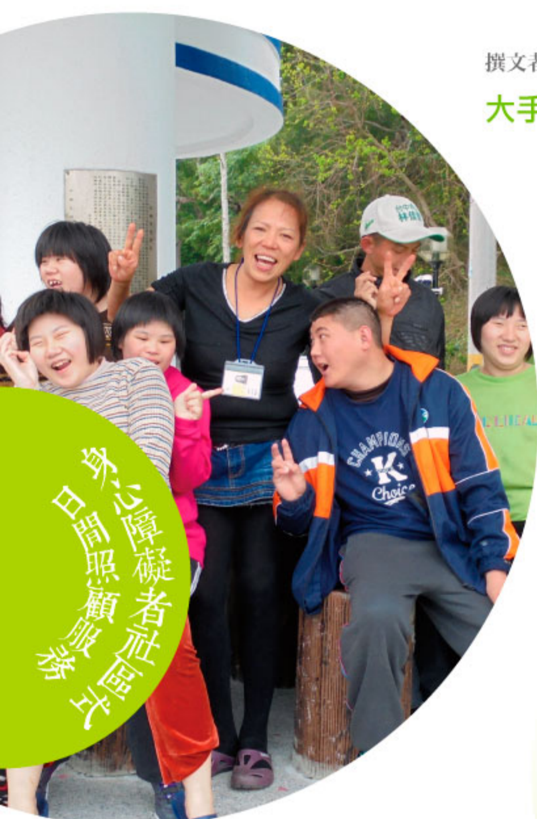
身心障礙者社區式日間照顧服務

這次活動不管是家長或是大天使每個人都是笑容滿面，天使們的笑容是我們最大動力來源。