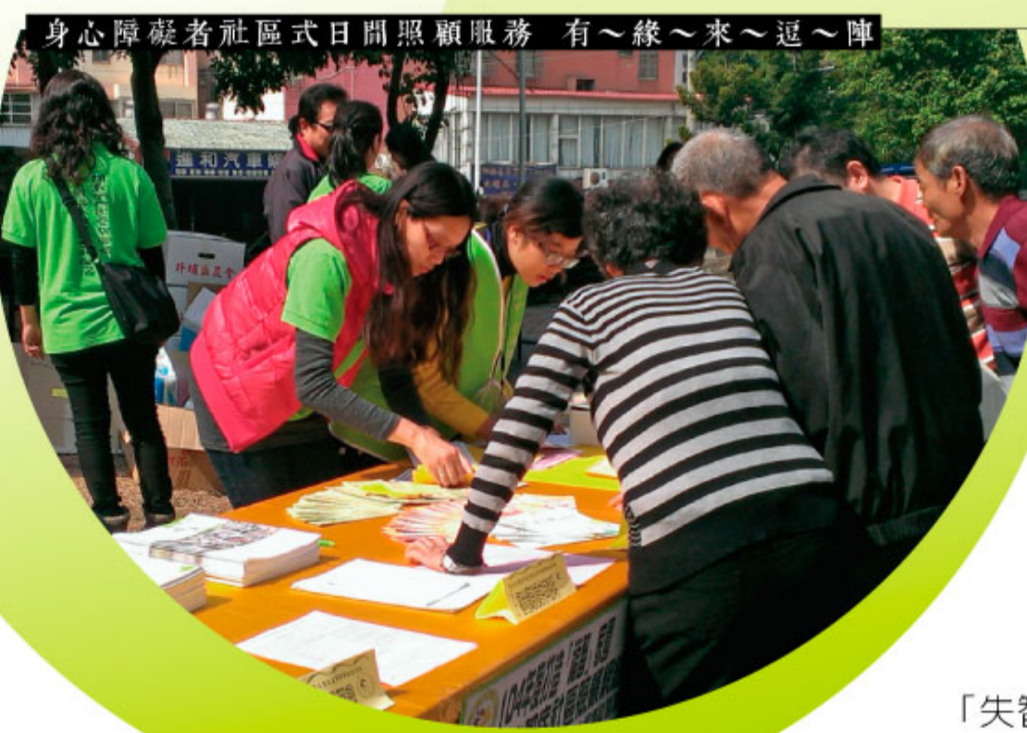
身心障礙者社區式日間照顧服務 有~緣~來~逗~陣