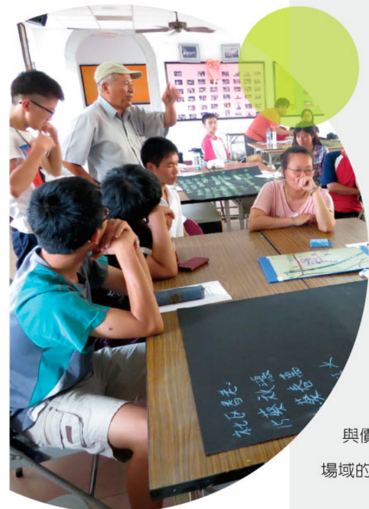
社區發展育成中心 陪伴 x 走過 x 學習

活動辦理前，總是會絞盡腦汁的思索著，社區夥伴於社區中面臨的限制為何？可發展利用的優勢在哪？因此，每當思索這些問題，看著每年度得獎的社區，就希望能找尋符合相同特質之社區進行參訪，了解該社區如何突破限制，發展社區特色，讓臺中市的社區可藉由一次次觀摩經驗的習得，激發不同思維模式，創造各式活動發展之想像，使社區依據在地特色發展，亦在發展同時兼顧照顧社區弱勢族群之目的。