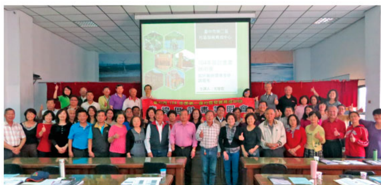
社區發展育成中心 陪伴 x 走過 x 學習

故，願身處在社區生活的我們，能共同秉持「分享福氣即是有福氣」的信仰，持續認真的分享福氣於生活中。